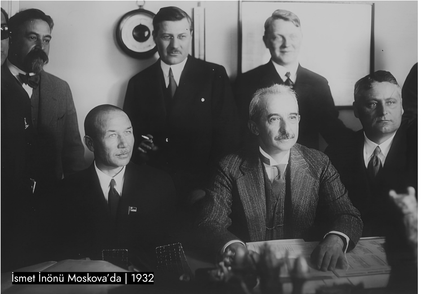
İsmet İnönü Moskova'da | 1932

Özetle, bugüne dair bir ittifak tartışması ancak ve ancak sosyalizm çatısı altında yapılabilir. Buna karşılık hiçbir şekilde altı doldurulmamış ve sonunda soluğu güncel sağın içinde alan hezeyanların "özgün" olma hırsı nedeniyle hiçbir ittifak ilişkisine dahil olmadan "steril" bir inzivada etkisizleşmeye doğru evrildiğini, ittifak adı altında yalnızca kendi içindeki farklı isimleri yanyana getiren bir homojenliği temsil etmekten öte hiçbir etkisi olmayacağını görmemiz kaçınılmazdır.