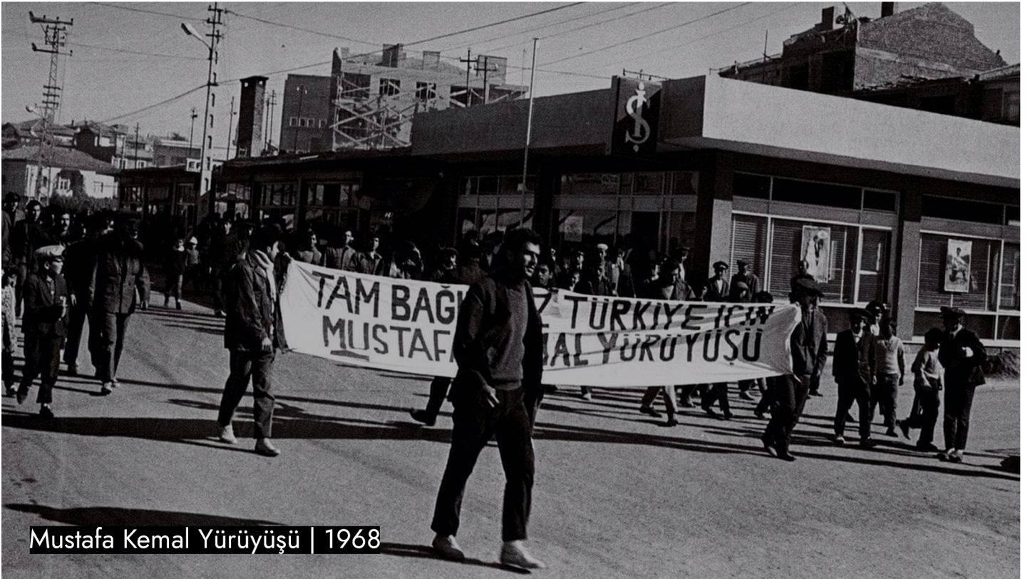
Mustafa Kemal Yürüyüşü | 1968